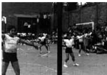
Barcelona, anys setanta

no sempre amb els recursos necessaris. Les escoles han crescut i s'han acollit més infants, però el pati ha anat minvant.